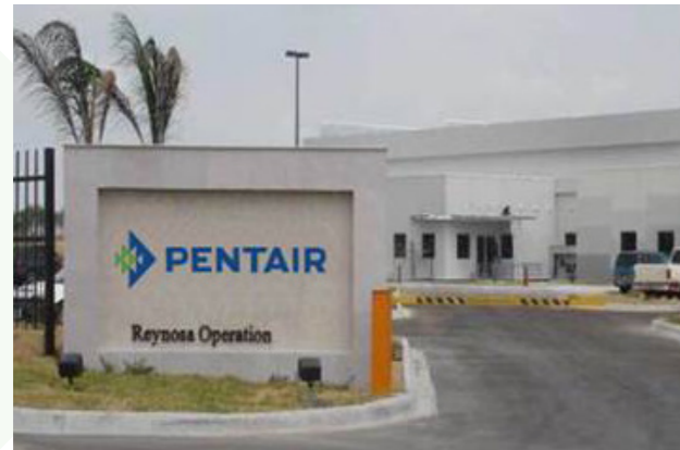
Pentair Reynosa, Mexiko

Meltblown-Filterkartuschen, während sich Pentair Reynosa in Mexiko hauptsächlich auf Faltenfilterkartuschen konzentriert. Diese beiden Pentair-Unternehmen sind nach ISO 9001:2008 zertifiziert.