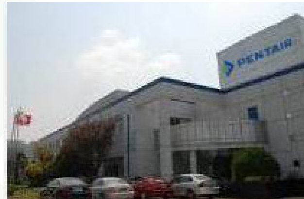
Pentair Suzhou, China